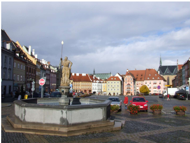
Eger / Tschechien

– Programmänderungen oder Hotelwechsel innerhalb der gleichen Kategorie vorbehalten –