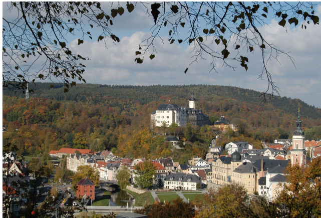
Vogtland bei Greiz

Es ist vorgesehen, dass an einigen Orten der Kantor der jeweiligen Gemeinden für die Gruppe auf der Orgel spielen wird.