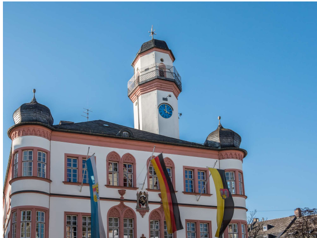
Hof in Oberfranken

Am Morgen verlassen wir Bonn und fahren über Würzburg und Bamberg in die oberfränkische Stadt Hof, Mittelpunkt des bayerischen Vogtlands. Dort erwartet uns eine Altstadtführung und es ist ein Orgelspiel auf der Heidenreich-Orgel in St. Michaelis vorgesehen (alle Orgelspiele vorbehaltlich der Verfügbarkeit der jeweiligen Organisten, sonst wenn möglich an alternativen Orten). Es bleibt Freizeit für einen kleinen Bummel über den Weihnachtsmarkt. Danach geht es weiter nach Plauen, wo wir für die gesamte Dauer der Reise die Zimmer im sehr zentral gelegenen Dormero Hotel beziehen. Abendessen im Hotel.