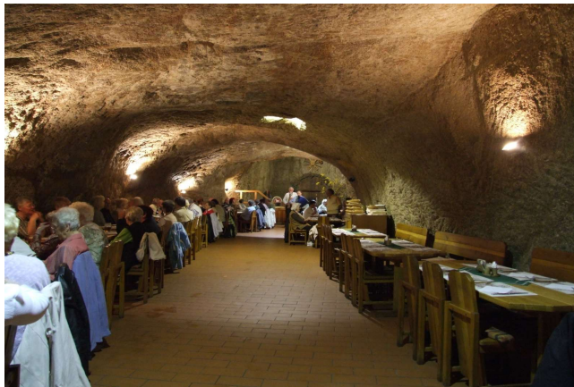
Unterirdisches Restaurant Böhmen

Heute brechen wir etwas früher auf und machen uns auf den Weg ins zu Tschechien gehörende böhmische Vogtland. Am Vormittag erkunden wir Eger. Das Mittagessen findet in einem unterirdischen Restaurant statt. Nachmittags bummeln wir durch das Zentrum des ebenfalls in Böhmen gelegenen Städtchen Marienbad und es bleibt Zeit für den Weihnachtsmarkt.