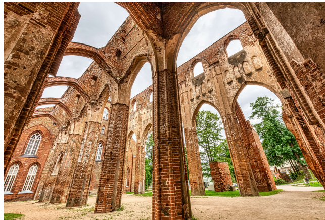
Kathedrale von Tartu

19.05.2025: Nach dem Frühstück machen wir uns auf den Weg in die zweitgrößte Stadt Estlands, nach Tartu. Die typische Studentenstadt ist eine der europäischen Kulturhauptstädte 2024. Wir spazieren durch die historische Altstadt der bereits vor knapp 1000 Jahren erstmals urkundlich erwähnten Stadt. Abends geht es zurück in unser Hotel in Tallinn.