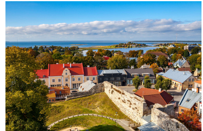
Haapsalu an der Ostsee

Gegen 16:30 Uhr verabschieden wir uns am Flughafen von unserer Reiseleiterin und fliegen um 18:40 Uhr zurück nach Frankfurt. Dort wartet ein Reisebus für den Transfer zurück nach Grafschaft. Rückkehr gegen 23:00 Uhr.