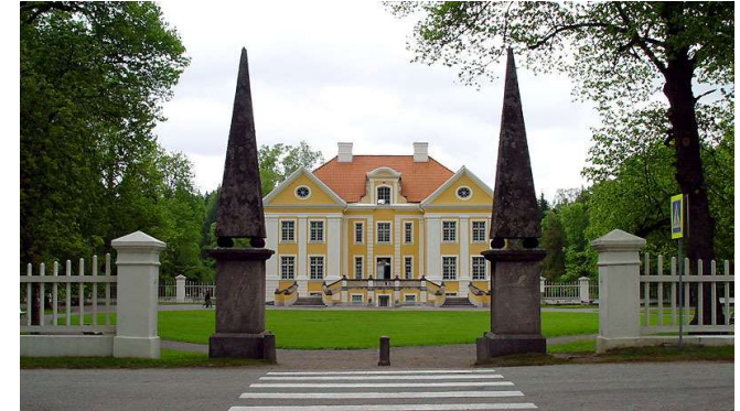
Gutshof Palmse im Laheema Nationalpark

20.05.2025: Heute geht es ins Landesinnere: Wir unternehmen einen Ausflug in den Lahemaa Nationalpark in der Nähe von Tallinn. Neben der außergewöhnlichen Landschaft dieser Region Estlands beeindrucken die kleinen Fischerdörfer und Gutshöfe im Nationalpark.