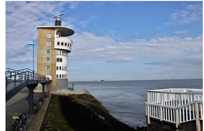
Alte Liebe Cuxhaven

In Cuxhaven unternehmen wir eine Stadtrundfahrt mit dem Hafen und der Alten Liebe. Das Orgelspiel des heutigen Tages ist in der St. Severikirche in Otterndorf vorgesehen.