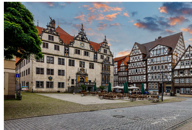
Fachwerk und Renaissance: Hannoversch Münden