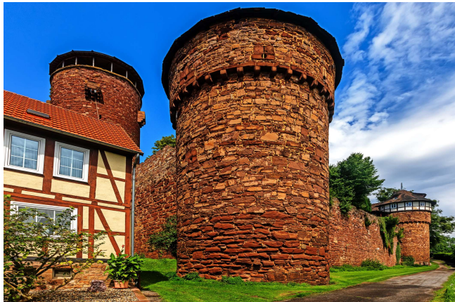
Trendelburg mit Rapunzelturm