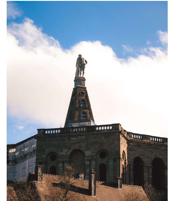
Das Herkules Denkmal beherrscht Kassel