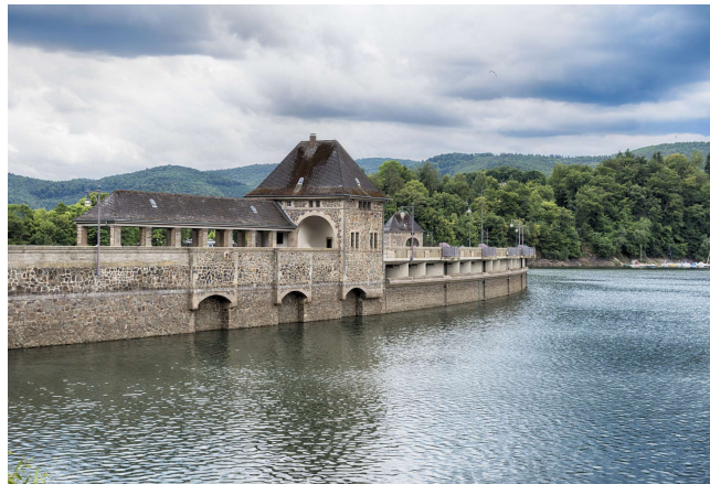
Die Talsperre Edersee

– Programmänderungen und Hotelwechsel innerhalb der gleichen Kategorie vorbehalten –